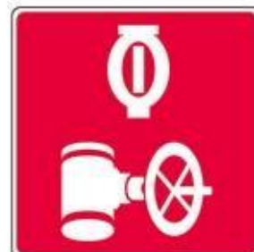
Valve du réseau de gicleurs