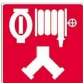
Raccords-pompiers pour le réseau de gicleurs et les cabinets d'incendie