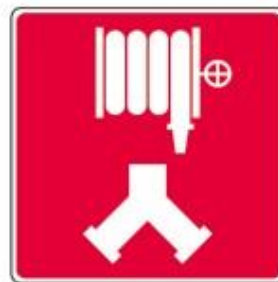
Raccords-pompiers pour les cabinets d'incendie