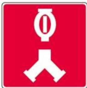
Raccords-pompiers pour le réseau de gicleurs